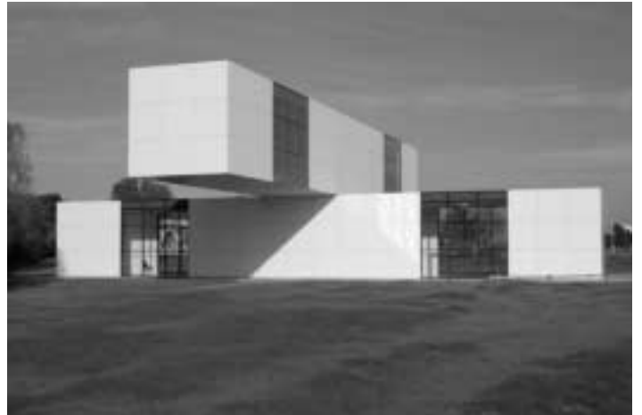
Stanley Brouwn, Het Gebouw (2005), een beeldend kunstproject van BEYOND. Uitvoerend architect Bertus Mulder, projectmanagement Cor Wijn. Foto Bertus Mulder (2005).

Het betoog van Molendijk doet beseffen hoeveel er in veertig jaar tijd is veranderd. Het laat ook mooi zien waar het gemeentelijke cultuurbeleid in de kiem vandaan komt: van politici die het volk in aanraking wilden brengen met kunst en cultuur; van