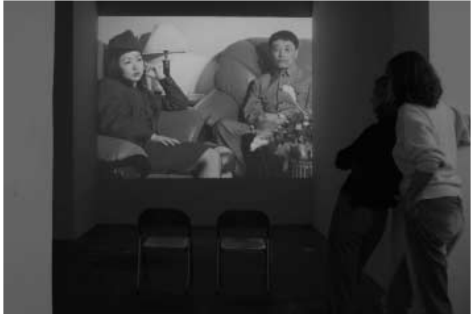
Yang Fudong (Shanghai), Honey , 2003; BüroFriedrich, 2003

Ik kreeg het idee om er ook iets te gaan doen. Je praat daarover met anderen, die reageren positief en zo is het balletje gaan rollen. In 1997 is BüroFriedrich van start gegaan aan de Friedrichstrasse in het voormalige Tsjechische Cultureel Instituut dat later gesloopt zou gaan worden. Het eerste driekwart jaar heb ik de boel met eigen geld draaiende gehouden. We presenteerden multimediale internationale beeldende kunst vooral in relatie tot andere disciplines zoals vormgeving, mode en architectuur. De exposities, met ook werk van onder andere Rineke Dijkstra, Arnout Mik, Marijke van Warmerdam, Viktor & Rolf enzovoort, sloegen aan, ook bij de pers. Na de officiële opening meldden zich particulieren die het initiatief financieel wilden ondersteunen. De Nederlandse overheid heeft