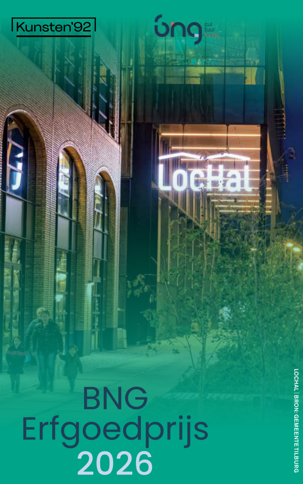
LOCTHAL, BRON: GEMEENTE TILBURG