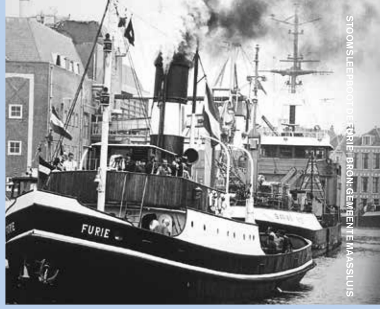
STOOMSLEPER 'FURIE'