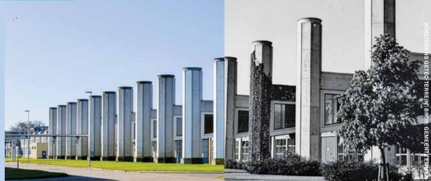
MOEDONS-ASGETIEF TERREIN