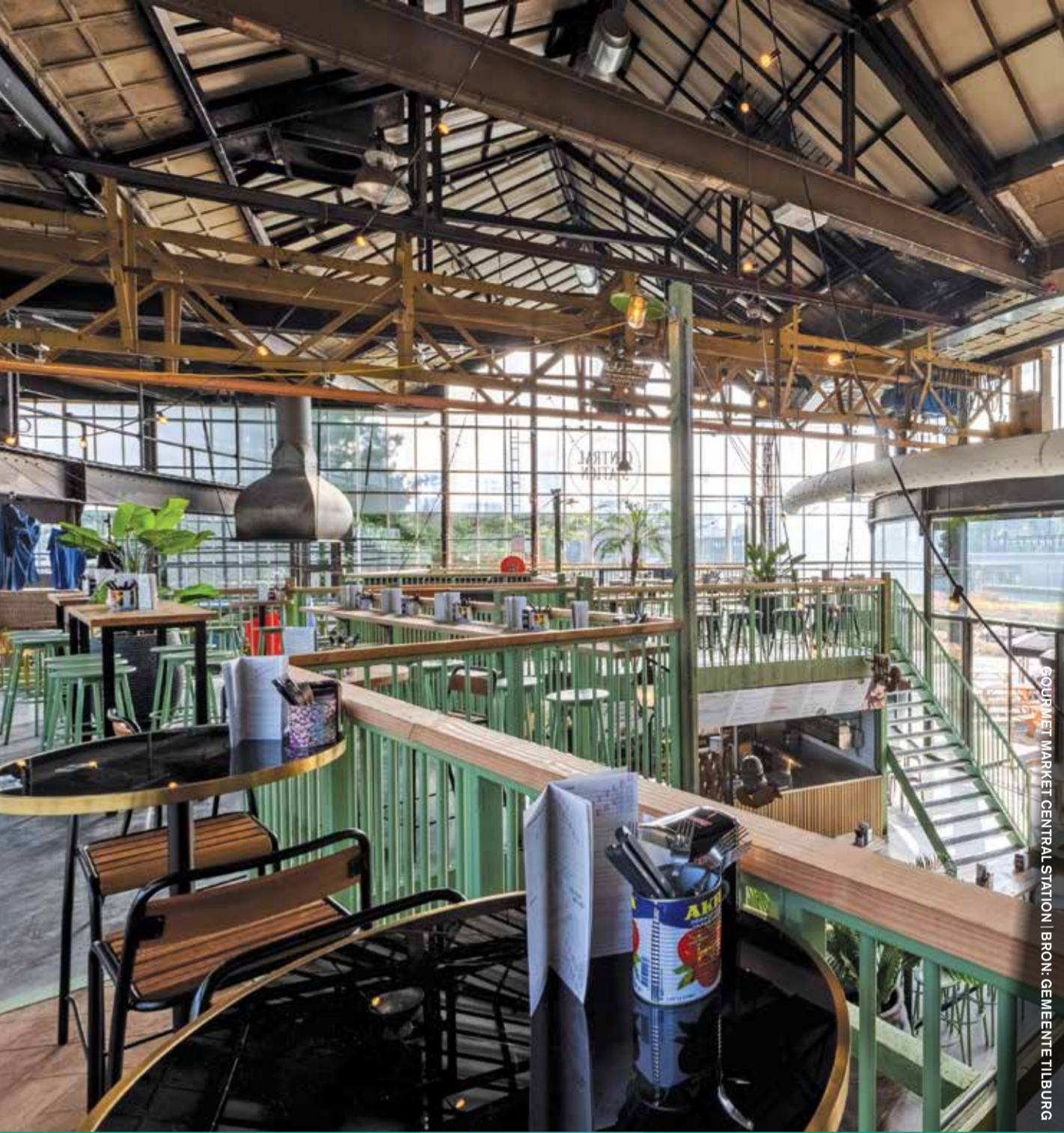
FOOTBALL MARKET CENTRAL STATION