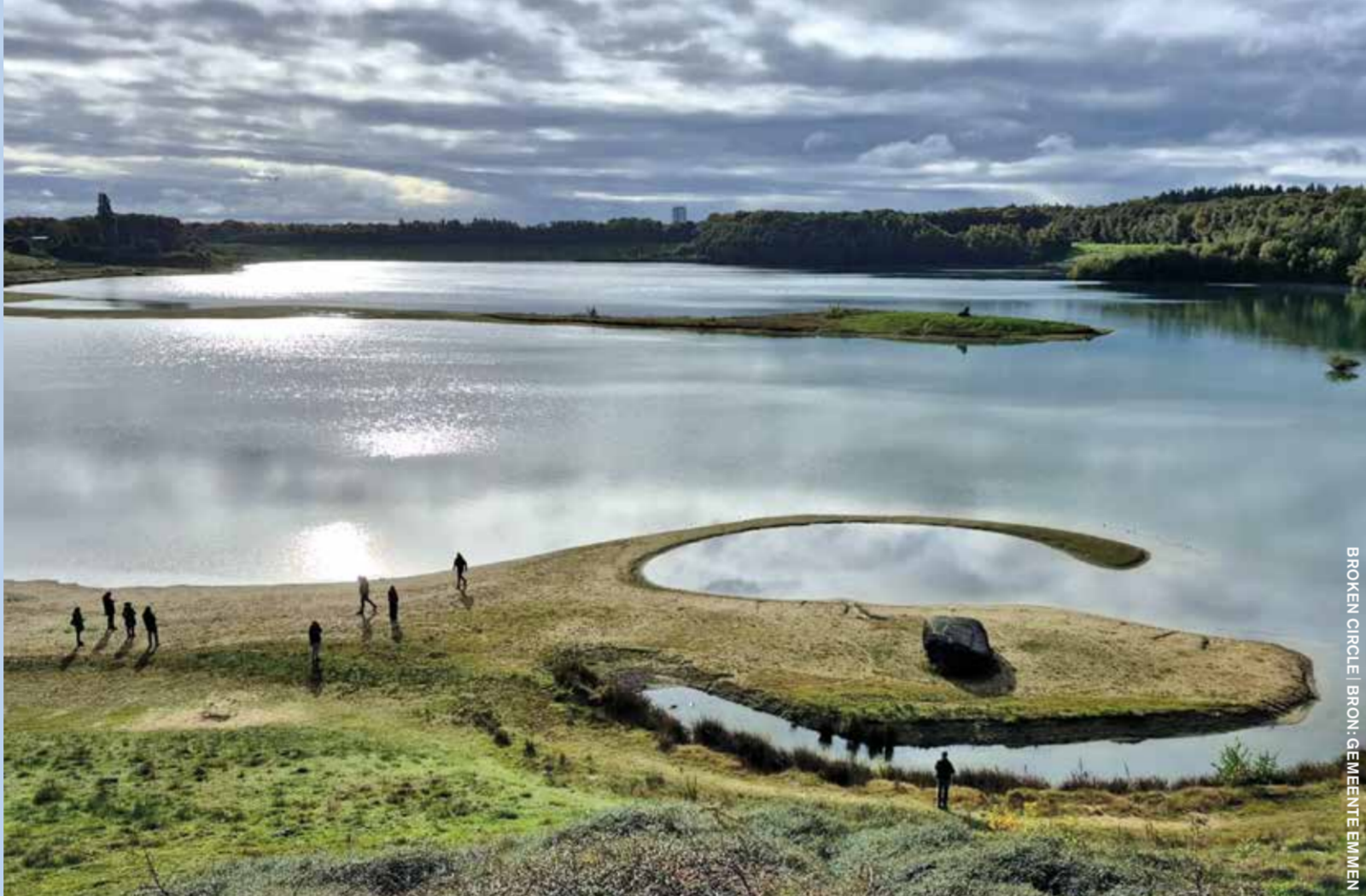
BROCKEN CIRCLE