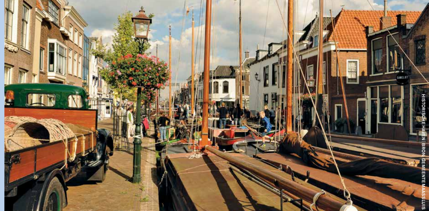
HISTORISCH EILAND