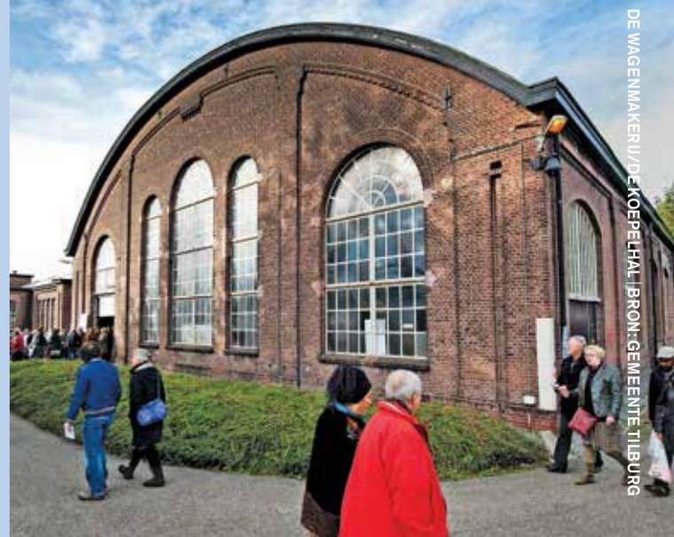
DE AGENVAARVEN/DE OEFERDIAAL

en arbeiderswijken bepalen het stadsbeeld. Deze geschiedenis is diepgeworteld en geeft de stad een rauw karakter. De gemeente Tilburg omarmt dit erfgoed, deelt deze geschiedenis actief met haar inwoners en ziet dit verleden als inspiratiebron voor de toekomst. In Tilburg vormt het industrieel erfgoed het visitekaartje van de stad. Afgelopen jaren heeft de gemeente Tilburg actief ingezet op het behouden en herbesteden van voormalige industriële panden. Eén van deze succesvolle projecten is de restauratie, herbesteding, investering en het beheer van de Spoorzone, de voormalige werkplaats van de NS. De gemeente heeft het voortouw genomen en heeft actief samengewerkt met belanghebbenden. Dit heeft geleid tot een unieke locatie, een stoere stedelijke mix, waar economie, onderwijs en wonen samenkomen.