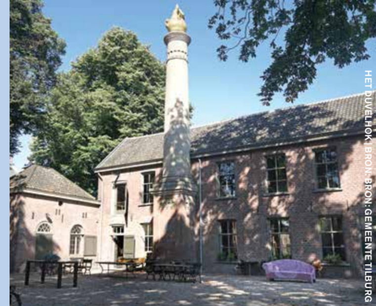
HET JUIVENHOK