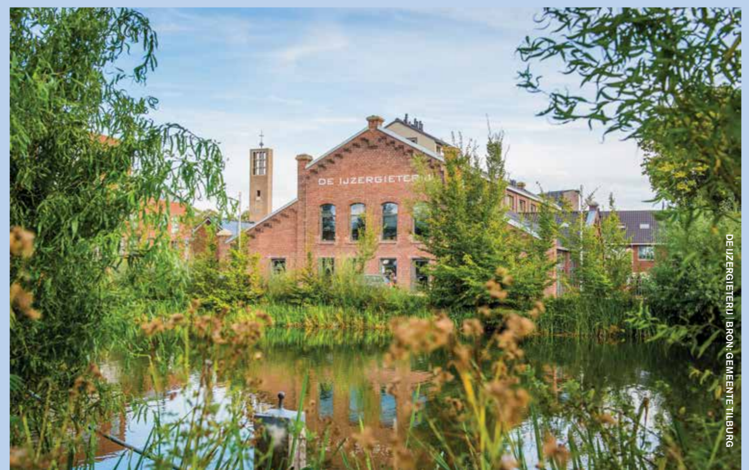
DE IJZERGIETER